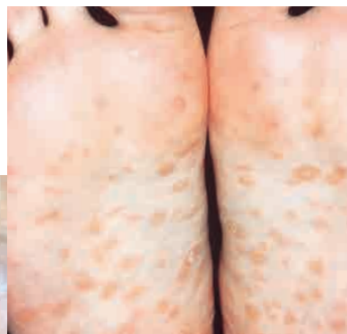
2 期梅毒的梅花样片状红斑 (足底)