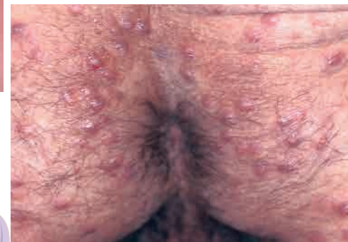
肛门周围的隆起皮疹