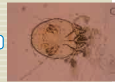
疥螨约 0.3mm 大小， 肉眼难以观察。