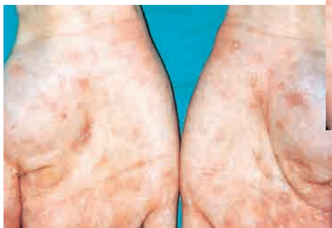
2 期梅毒的梅花样片状红斑 (手掌)