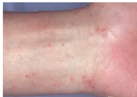
手腕周围的 红色小皮疹